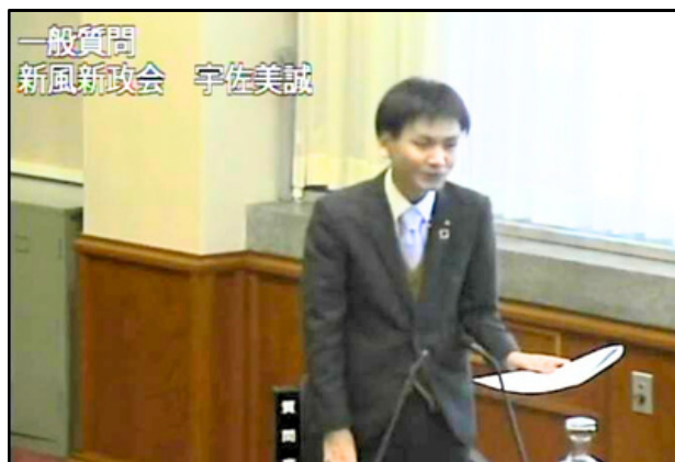
▲一般質問をしている様子

一般質問の様子は、議場での傍聴のほか、安中市ホームページからご覧いただけます。興味のある方はぜひ！