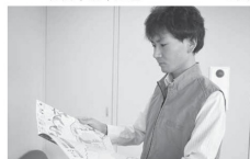
危険箇所を確認する防災士の市議会議員