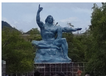
▲式典と平和公園の様子