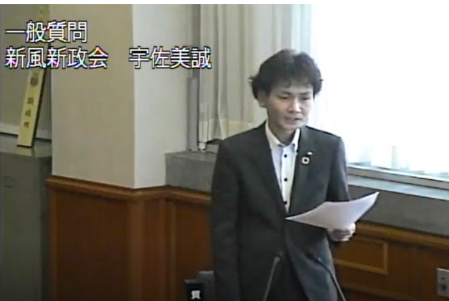
▲一般質問をしている様子