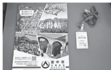
日頃から災害に備えます