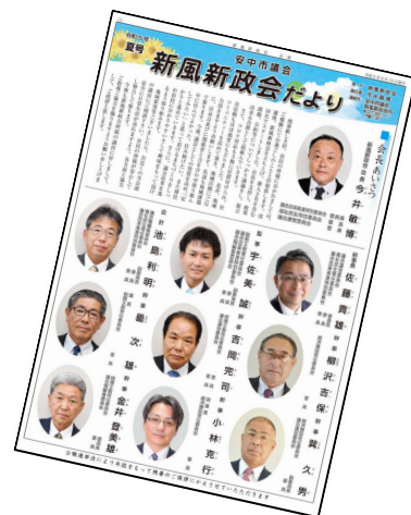
▲初の新風新政会だより。お盆明けに全戸配布されています。

安中市議会の最大会派である「新風新政会」へ所属することとなりました。10名の議員が在籍しており、議員定数の半数となる会派です。